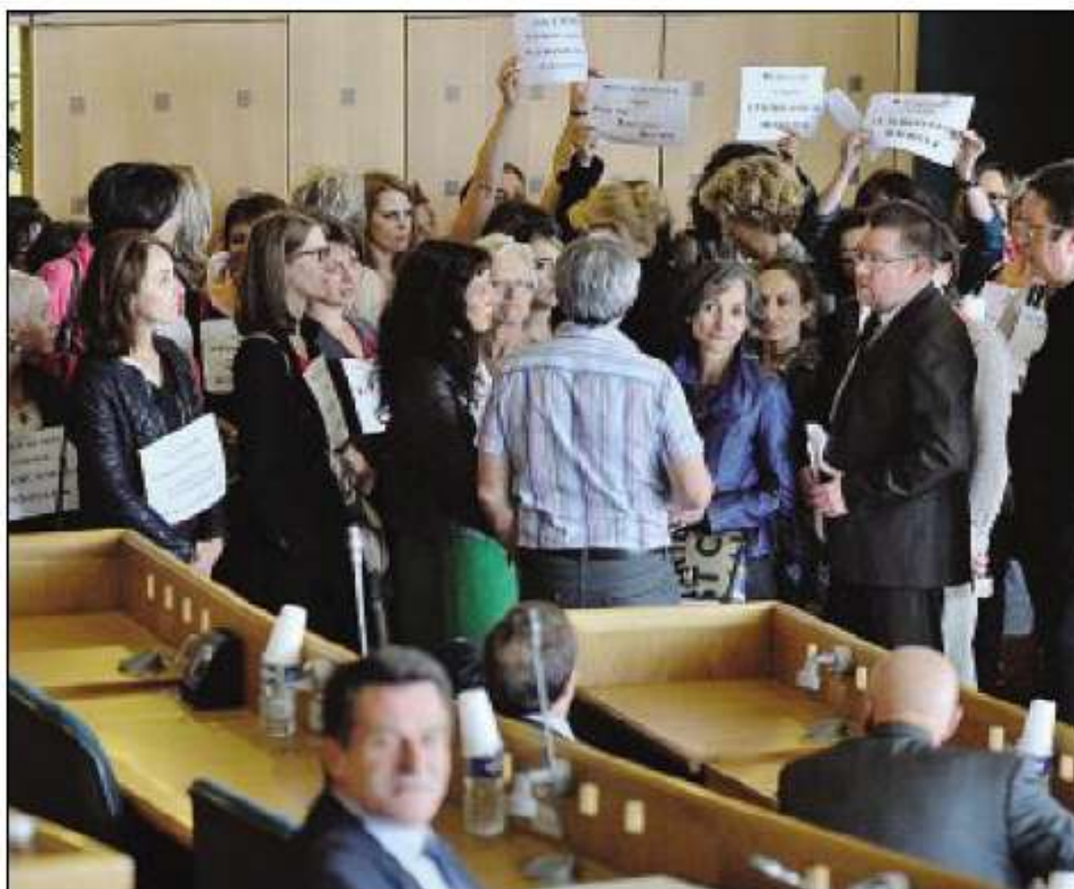
MANIFESTATION. En grève depuis hier, les travailleurs médico-sociaux ont envahi l'assemblée départementale. La séance a été levée plus d'une demi-heure.

Devant leur refus de quitter la salle, le président Jean-Yves Gouttebel a levé la séance pendant plus d'une demi-heure. Les représentants des syndicats (CGT-FO-Sud) ont été finalement reçus par le vice-président Claude Boillon.